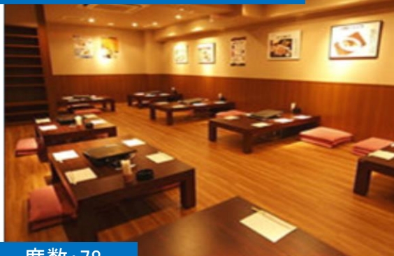
東京都文京区：飲食店