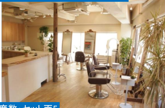
東京都新宿区：ヘアサロン

飲食店やヘアサロン、上記以外にマンションや宿泊施設など幅広い業種での導入が決まっています。お早めの導入で多くの企業様がコスト削減に成功されています。 ※一部離島は除きます。