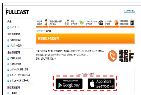
(「キャストポータル」でも告知開始)

フルキャストは、今後も登録スタッフの要望や意見を反映させて、サービスインフラの利便性や福利厚生サービスの拡充、また、積極的な外部サービスとの連携により、満足度の高いサービスの提供を目指していきます。